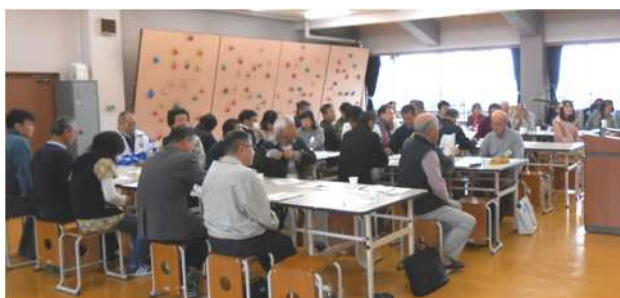
↑熱心に聴講する参加者の皆さん