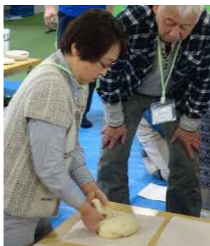
▲ひたすらコネコネ…