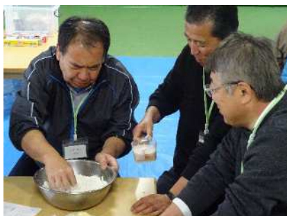
▲砂糖を溶かしたぬるま湯にイーストを入れ…