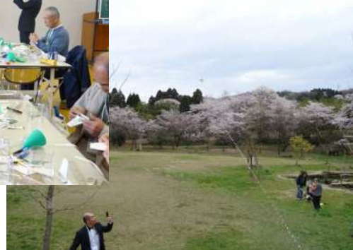
はるか彼方へ(本日の行方不明は2機)