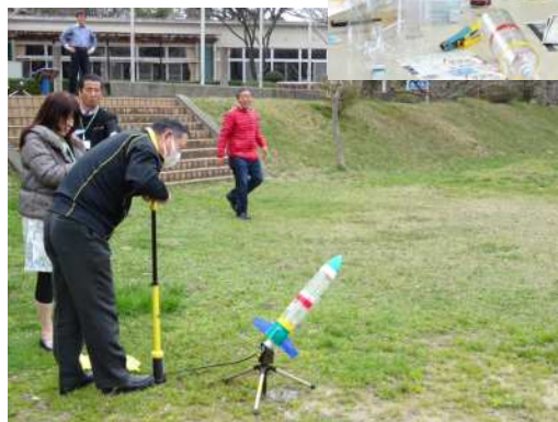
ポンピングは 20 回位？