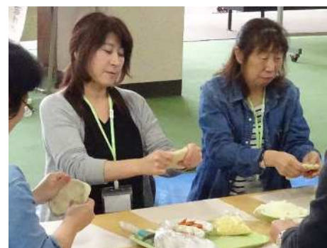
▲4等分して伸ばします