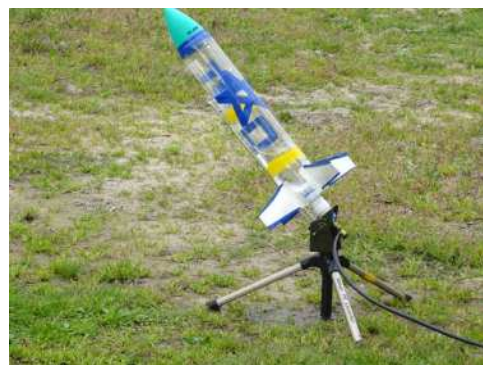
このカッコイイ雄姿を見よ!!