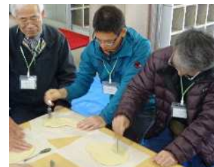
▲ガス抜きも忘れずに

※かまどの温度は 300~350℃に 保ちます。👉 ピザは約5分間 で焼きあがります。