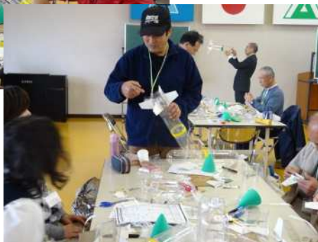
尾翼が一番大事です